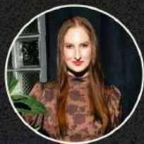
Валерия Костина Президент Союза